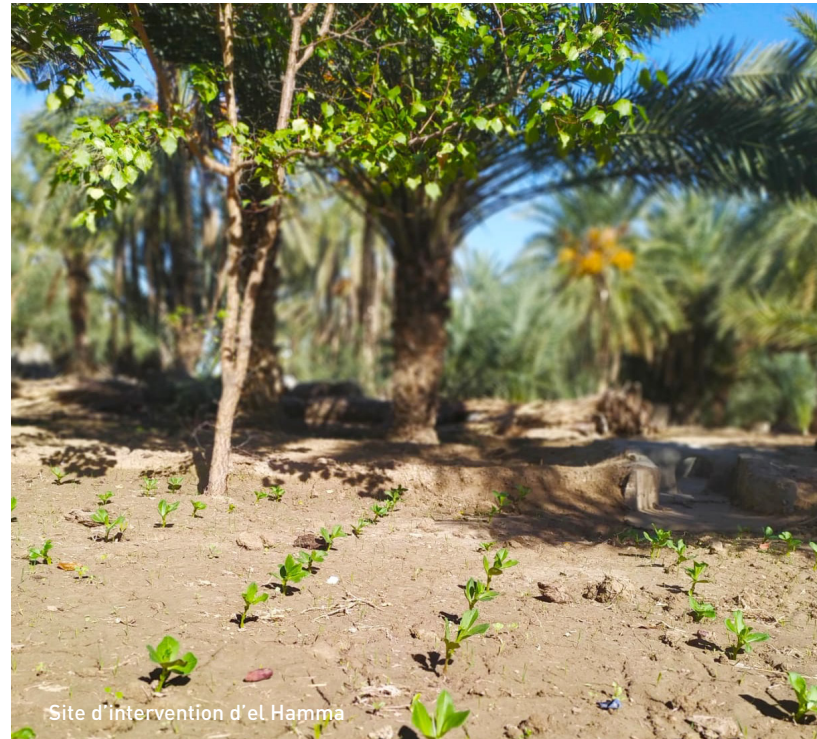
Site d'intervention d'el Hamma