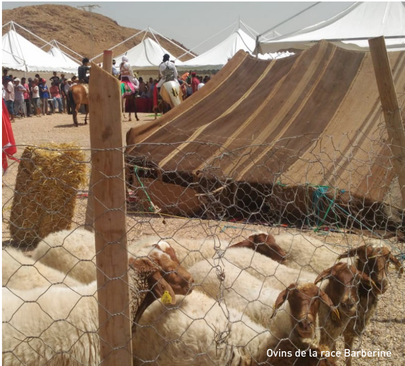
Ovins de la race Barbarine