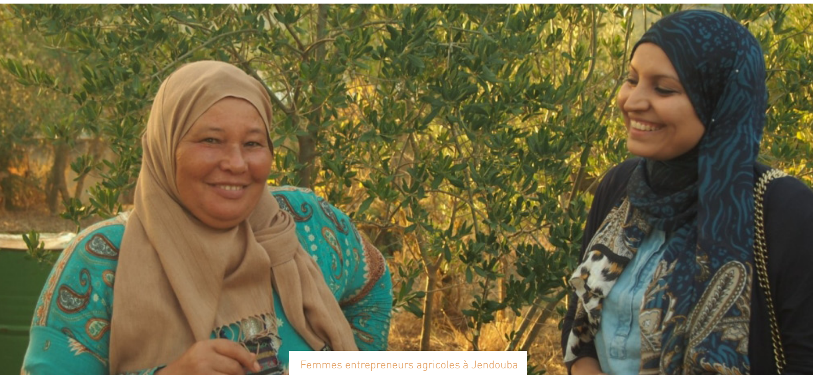
Femmes entrepreneurs agricoles à Jendouba