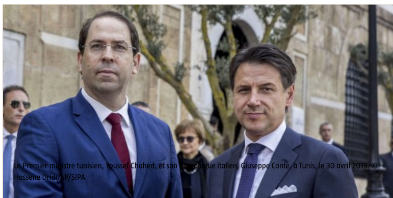
Le Premier ministre tunisien, Youssef Chahed, et son homologue italien, Giuseppe Conte, à Tunis, le 30 avril 2019.

Le premier sommet intergouvernemental entre les deux pays a eu lieu ce 30 avril à Tunis. L'occasion d'enraciner l'accord de coopération stratégique conclu entre les deux pays en 2012. Au cœur des discussions : la coopération énergétique, avec la signature d'un accord pour le nouveau « pont électrique » entre la Tunisie et la Sicile.