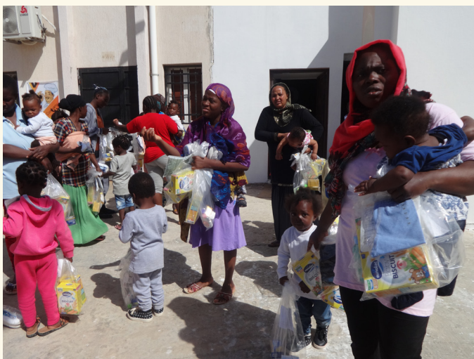
Distribution des produits de première nécessité géré par l'ONG Cefa dans un centre pour migrants et réfugiés