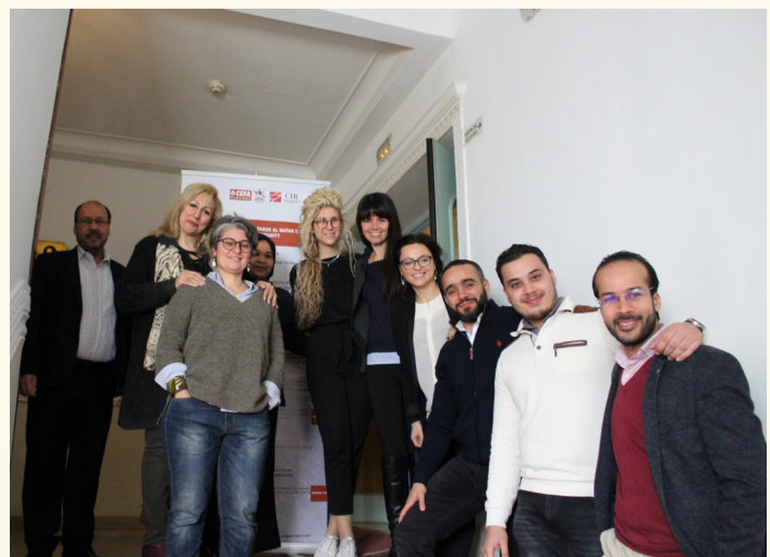
Formation pour le personnel sanitaire géré par l'ONG CEFA

Agence Italienne pour la Coopération au Développement – AICS Tunisi