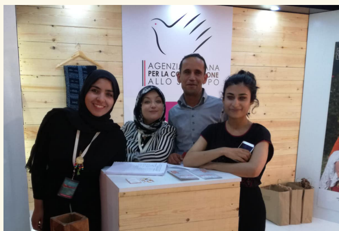
Lancement de la marque TATAOUI, Foire Artisanale, Tunis