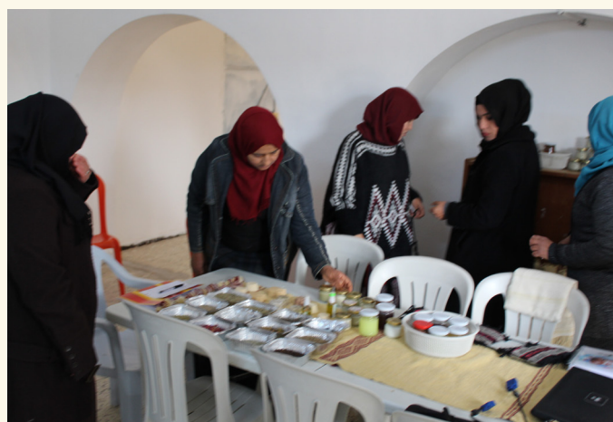
Groupement de développement agricole, Douiret, Tataouine

Agence Italienne pour la Coopération au Développement – AICS Tunisi