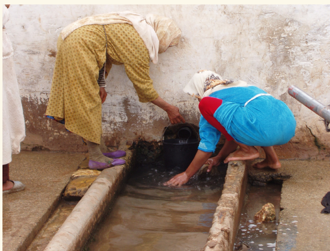
Femmes bénéficiaires du projet Pager II