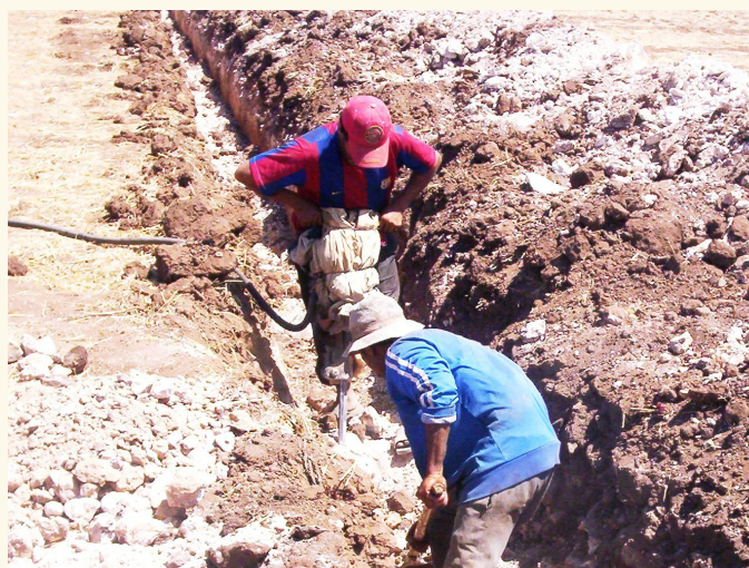
Les travaux dans le cadre du projet Pager II

Agence Italienne pour la Coopération au Développement – AICS Tunisi